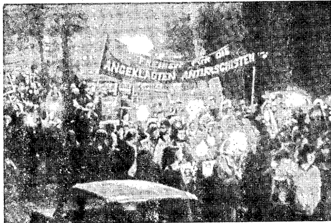
Demonstration in Hamburg am 9. 11.

Vor diesem Hintergrund ist es verständlich, daß die Nerven des Richters nicht mehr die besten waren.