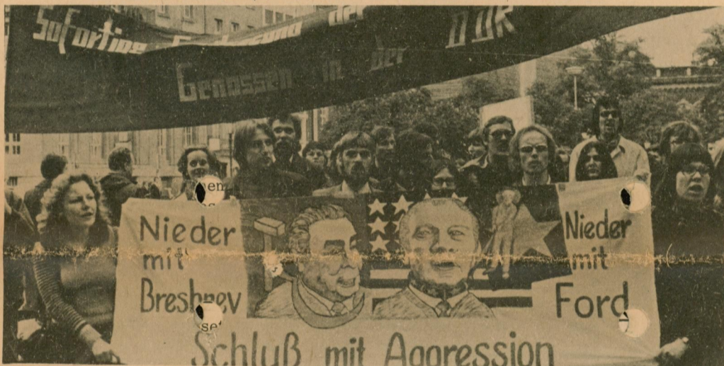
Bild: Demonstration in Bonn, 23. 5. In der ersten Reihe die ersten der befreiten Genossen

Am 9. Mai war in der DDR arbeitsfrei und die Breshnew Clique hatte die Werktätigen aufgerufen, das "ewige Bündnis" mit der Sowjetunion und der Sowjetarmee "zu feiern. Gemeint ist damit die imperialistische Besetzung der DDR durch die Sowjetarmee zur Absicherung der Ausplünderung der deutschen Arbeiterklasse, die Waffenhilfe der DDR-Truppen bei der Unterjochung der Völker, die sich gegen das sozialimperialistische Hegemoniestreben wehren, z. B. bei der Invasion in der CSSR.