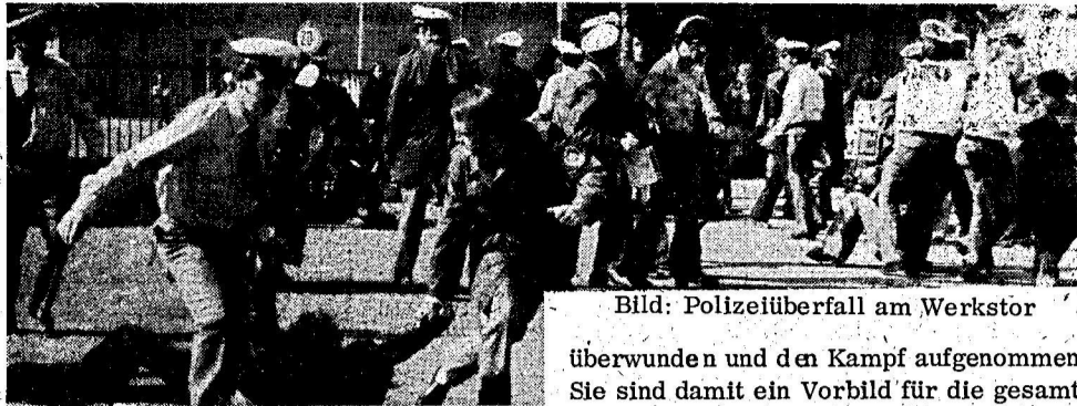
Bild: Polizeiüberfall am Werkstor