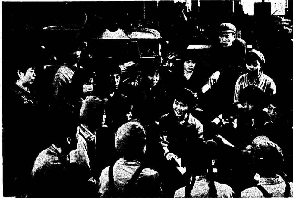
IM SOZIALISTISCHEN CHINA HABEN DIE MENSCHEN AUFGEHÖRT, NUR ANHÄNGSEL DER MASCHINEN ZU SEIN. WÄHREND BEI UNS DER PROFIT REGIERT, SIND IN CHINA DIE ARBEITER DIE HERREN DER FABRIK. SIE BESTIMMEN ÜBER DIE PRODUKTION UND SETZEN IHRE FÄHIGKEITEN ZUM WOHLERGANG DES GANZEN VOLKES EIN. Im Bild: eine gemeinsame Diskussion von Arbeitern und Studenten in der Maschinenfabrik Shenyang über die Geschichte und die ideologischen Hintergründe der Verräterclique um Lin Biao.

Tsetzung). Beispielhaft kann man anhand der Volksrepublik China sehen, daß dort die Arbeiterklasse über die Produktion bestimmt, daß auf dieser Grundlage die Arbeitslosigkeit überwunden werden kann. Die Errichtung des Gemeineigentums an Produktionsmitteln und das gemeinsame Ziel der Arbeiterklasse, der Aufbau des Sozialismus, machen es möglich, die gesamte gesellschaftliche Arbeitskraft und alle Produktionsmittel auf einheitliche Weise einzusetzen. Mit dem einheitlichen Staatsplan können die Arbeitskraft und die Produktionsmittel auf die verschiedenen Gebiete der nationalen Wirtschaft aufgeteilt werden und so Menschen, Material usw. im Lichte der Bedürfnisse der Bevölkerung, des Staates und der objektiv zwischen den verschiedenen Gebieten existierenden proportionalen Beziehungen rationell eingesetzt werden. So kann sich die Wirtschaft gleichmäßig und schnell entwickeln.