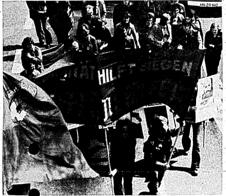
Bild rechts: Maidemonstration in Hamburg Bild links: Maidemonstration in Westberlin