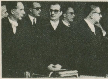
1964 Horst Mahler als Staatsanwalt im Thyssen Prozess.