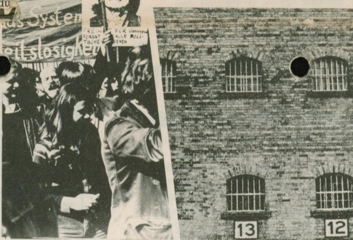
8. Oktober 1970 Verhaftung von Horst Mahler.